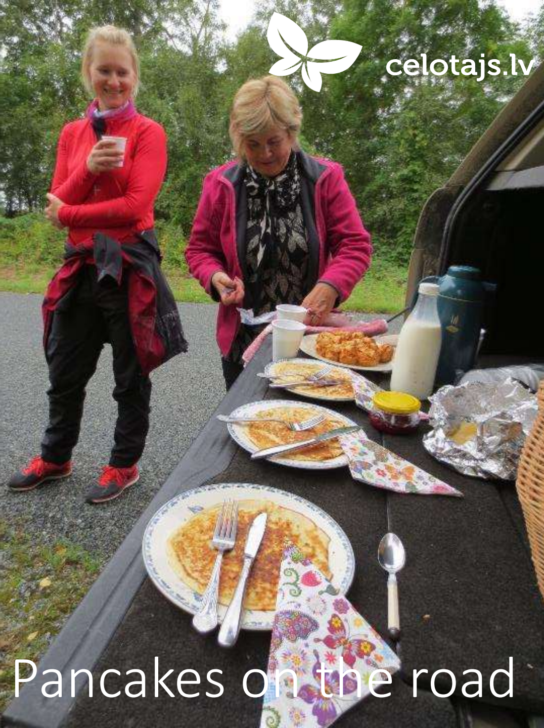
Pancakes on the road