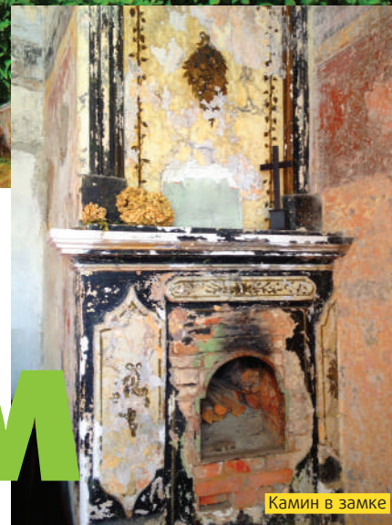
Камин в замке

Ч тобы отмотать назад почти семь веков: именно в это время было начато строительство замка в Алсунге. А главное, чтобы узнать, кто же такие суйты, и приобщиться к канонам народных традиций латвийской культуры, где общине суйтов отведено особое место. «Культурное пространство суйтов» внесено в 2009 году в Список всемирного культурного нематериального наследия ЮНЕСКО, требующего срочного спасения. Выходит — твое путешествие в гости к суйтам не только познание родного края, но и часть международной миссии. Присоединяйся, точно не пожалеешь!