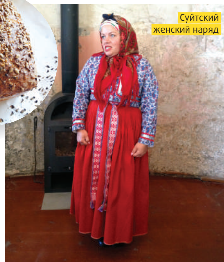
Суйтский женский наряд