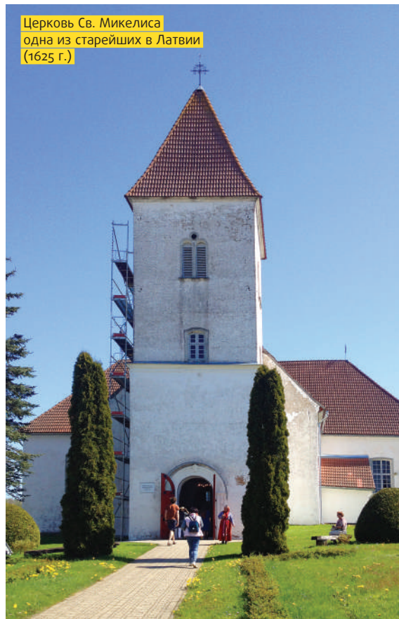
Церковь Св. Микелиса одна из старейших в Латвии (1625 г.)

Даже если ты не любитель посещать храмы и соборы, сделай исключение для церкви Св. Микелиса (архангела Михаила). Здесь царит удивительная атмосфера! Ее слагаемые: особая воздушность белых стен, грациозные завитки алтаря в стиле барокко, искусные работы резчика по де-