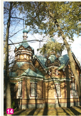
Православный храм Святых апостолов Петра и Павла