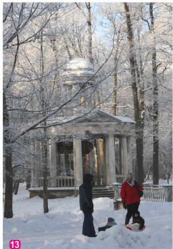
Павильон-ротонда "Островок любви"

В национальном парке "Кемери" создан ряд пешеходных, велосипедных, водных и автотуристических маршрутов – ищите листы www.celotajs.lv и метки в природе!