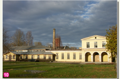
Бывшая Кемерская купальня