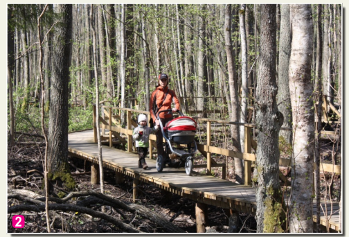
Тропа влажного леса

27 Бывший санаторий "Лива" – память о бывшей мощи курорта всесоюзного значения. Сохранился интересный рассказ о том, что гостиница построена на особых газовых подушках, чтобы огромные здания не погрузились в нестабильный грунт Кемери.