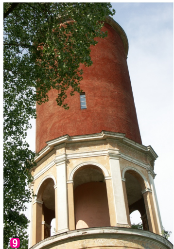
Кемерская водонапорная башня