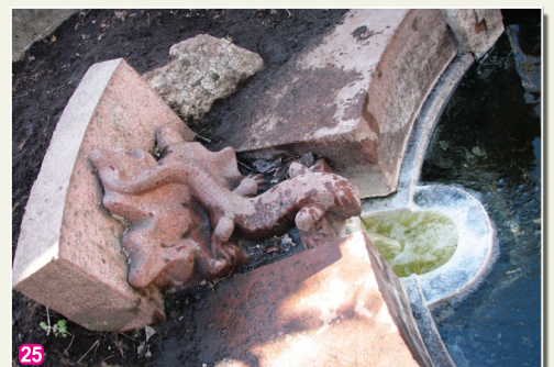
Серных источников "Ящерка"