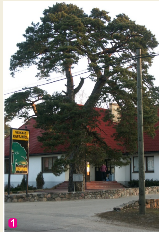
Вековая сосна в Бигауньциемсе