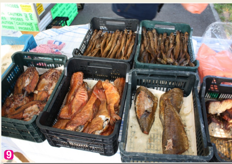
Рагациемский Рыбный базар