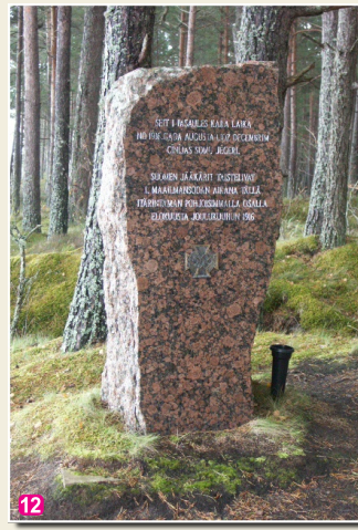
Место памяти борьбы финских егерей в Клапкалнциемсе