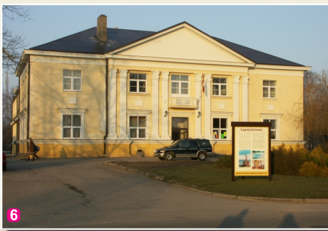
Лапмежциемский народный дом

12 Место памяти борьбы финских егерей в Клапкалнциемсе . Место, где захоронены пять павших финских солдат Первой мировой войны. В мае 2004 года установили по новой первичный, установленный в 1929 году и снесенный в Советское время памятник. В Лапмежциемском музее можно посмотреть фотографии и получить более подробную информацию о финских егерях.