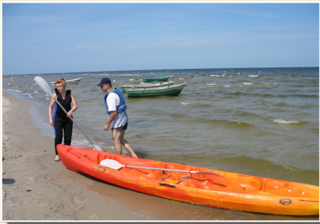
Лодочки на пляже Рагациема