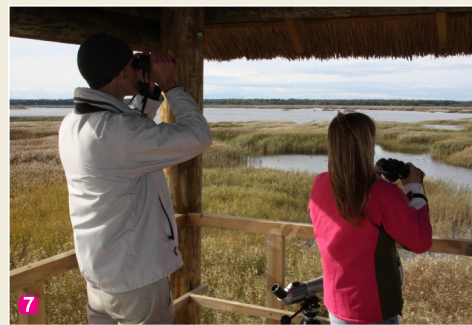
Вышка для наблюдения за птицами Каниерского озера