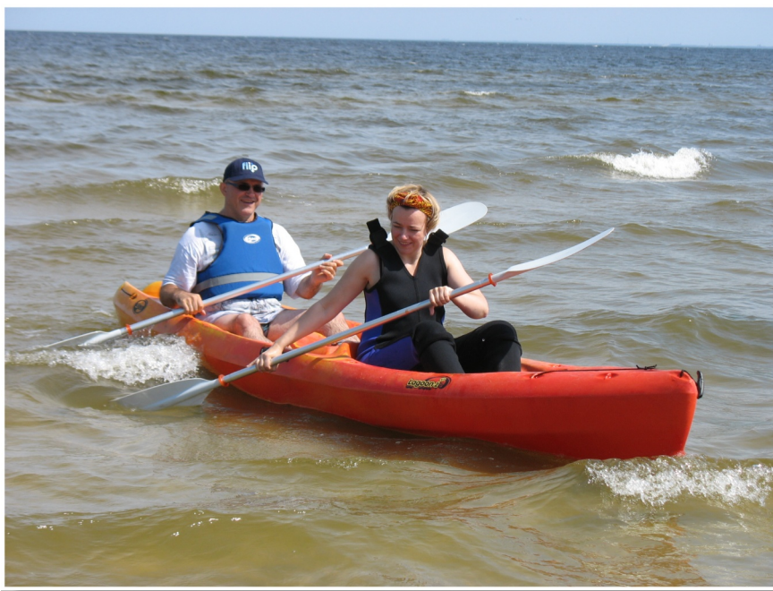
Морская лодка на побережье Лапмежиемса

www.jurmala.lv 67147900; www.daba.gov.lv 67730078