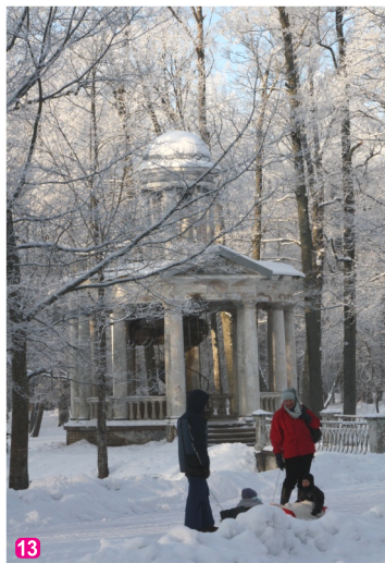
Mīlestības saliņas paviljons - rotunda

Ķemeri nacionālajā parkā ir izveidoti vairāki pārgājienu, velo, ūdens un autotūrisma maršruti – meklējiet maršrutu lapas www.celotajs.lv un atzīmes dabā!