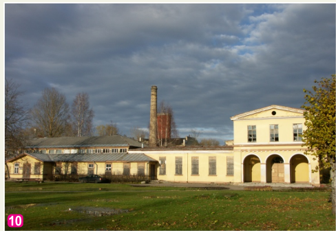
Bijusī Ķemeru peldiesterāde