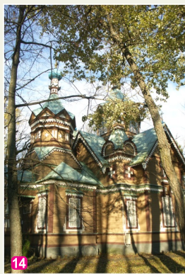
Sv. Apustuļu Pētera un Pāvila pareizticīgo baznīca