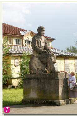
7 Pieminekļis I. Pavlovam

39 Vecie kūdras karjeri - nākamā vieta aiz Ķemeriem, kur jau daudz lielākā apjomā (g.k. pirmās Latvijas brīvvalsts laikā) tika iegūta kūdra.