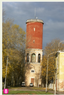
8 Ķemeru ūdenstornis