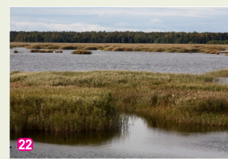
22 Kaņiera ezers