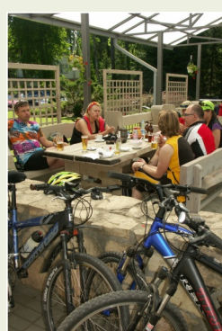
Kafejnīca "Valguma pasaule"