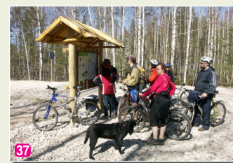
37 Informācijas stends Kalnciema - Kūdras ceļa malā