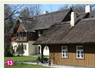
13 Meža māja