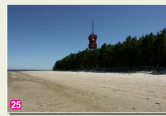
25 Ragaciema bāka