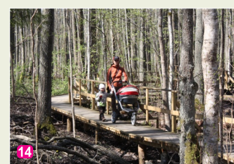
14 Melnalkšņu dumbrāja taka