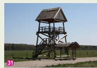
31 Putnu vērošanas tornis Dunduru pļavās