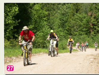
27 Uzbrauciens Lustužkalnā