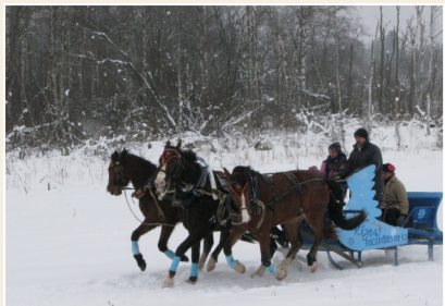
Trijūga kamanas R zņas nacionālajā parkā

Kāzu un citu godu noformēšana ar zirgu iesaistīšanu (karietes, kamanas, pajūgi, tēpi u.c.).