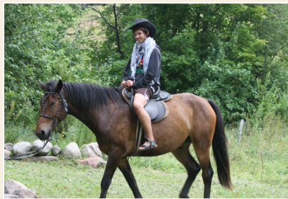
Tristu izjāde Rudo kumelu pauguros