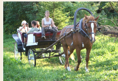
Tristu vizināšana pajūgā