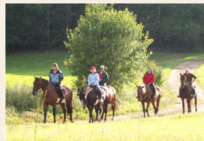
Tristu izjādes grupā