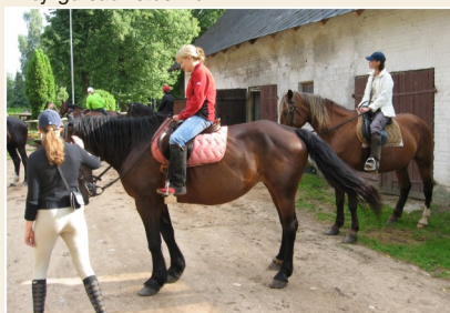
Instrukcijas pirms došanās izjādē