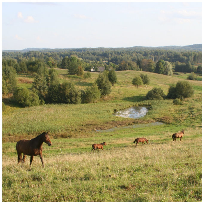
R zņas pauguraines ainava