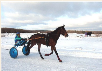
Pajūgu sacīkstes ziemā