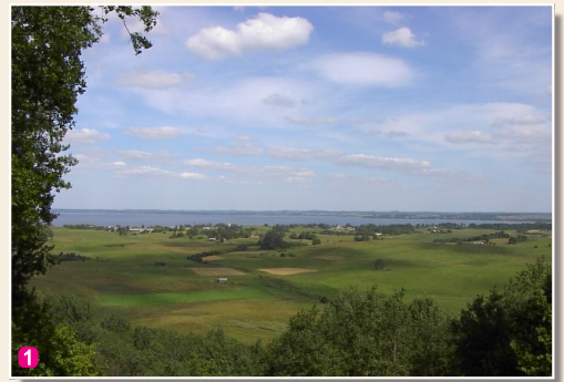
Skats uz Rāznas ezeru no Mākoņkalna

18 Mākoņkalns - viens no populārākajiem nacionālā parka un Latgales novada tūrisma objektiem. Tā piekāvē izveidots labiekārtots autostāvlaukums, bet tā virsotnē uzved koka kāpnes. Mākoņkalnā atradusies 13. gs. celtā, praktiski neieņemamā Livonijas ordeņa Volkenbergas pils, no kuras līdz mūsdienām saglabājušies tikai pils aizsargmūra fragmenti. No lielpaugura plakanās virsotnes (247 m v.j.l., ap 60 m virs tuvākās apkārtnes) paveras viena no skaistākajām Latgales ainavām uz Rāznas ezeru. Teikas vēsta, ka pēc Volkenbergas pilskunga un viņa sievas nāves plašie pilsnovada īpašumi esot sadalīti viņu trim meitām - Rozei, Lūcijai un Marijai. Katra no māsām uz mantotās zemes uzcēlusi jaunu pili: Roze - Rēzekni, Lūcija - Ludzu, bet Marija - Viļaku. Mākoņkalna pakājē atklāta piemiņas plāksne - atgādinājums par 1938. gada Latvijas pirmās brīvvalsts prezidenta Kārļa Ulmaņa Latgales apmeklējumu.