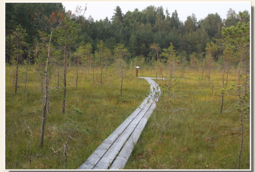
Laipu taka Andrupenē