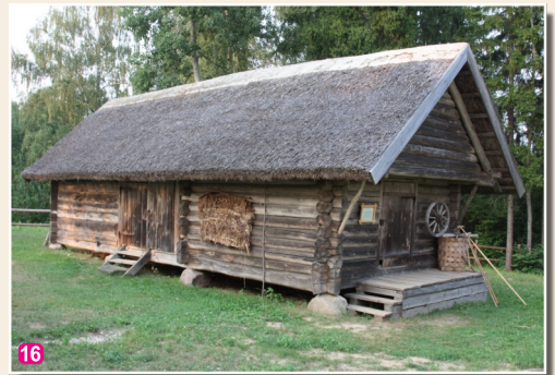
Andrupenes lauku sēta