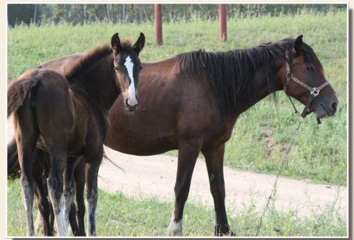
Latgales zirgi Rudo kumeļu pauguros