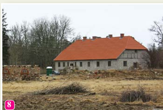
Жилое здание бывшей усадьбы пастора