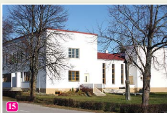
Народный дом ливов