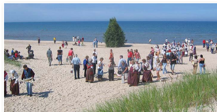
На побережье у Мазирбе