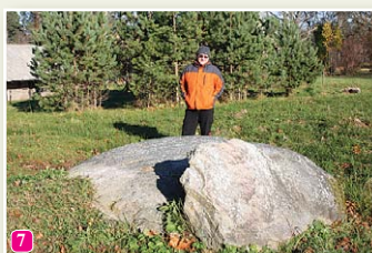
Чумной камень у церкви