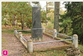
Das Denkmal vom alten Tazelis