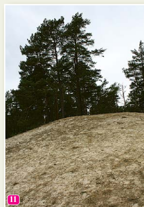
Die weiße Düne