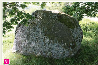
Der Große Peststein