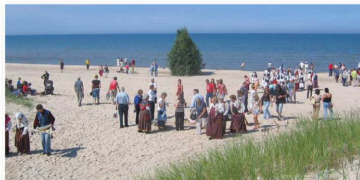
An der Meeresküste von Mazirbe