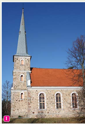
Die lutherische Kirche von Mazirbe

22 Der Platz von der ehemaligen Kneipe – in Ūbele am Rand von der Strasse Mazirbe-Cirste.