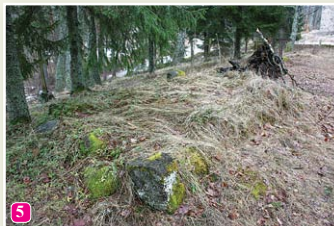
Grab vom Werwolf