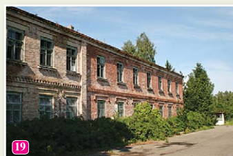
Das ehemalige Gebäude der Meeresschule