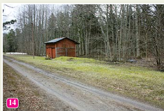
Die ehemalige Kleinbahn