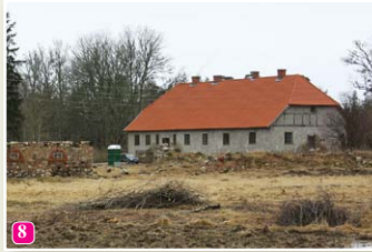
Das Wohnhaus vom ehemaligen Pfarrhof