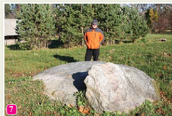
Die Peststeine bei der Kirche