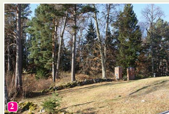
Der alte Grabhügel