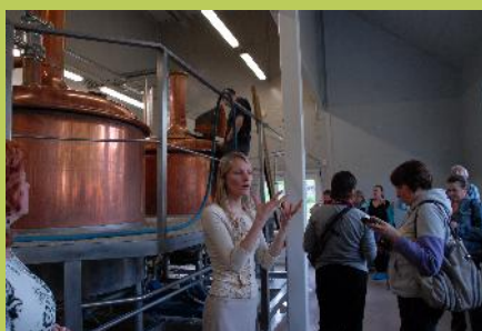
фото: Журналисты в экскурсии Valmiermuiza пивоварне

Примеры всех наших туров смотрите здесь.