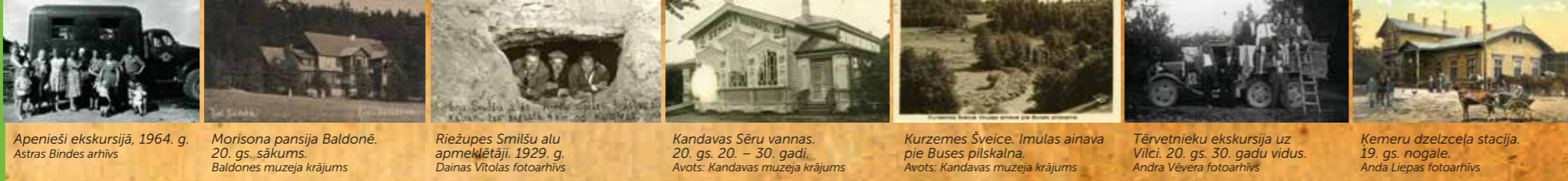
Apenieši ekskursijā, 1964. g.