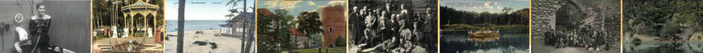
Dūņu pelde Ķemeros. 1935. g. Anda Liepas fotoarhīvs Sēravota paviljons un sēravots (tagad „Ķirzaciņa”). 1910. g. Anda Liepas fotoarhīvs Jaunkemeru pludmale. Anda Liepas fotoarhīvs Turaidas pilsdrupas. 20. gs. sākums. Latvijas Nacionālās bibliotēkas Baltijas Centrālās bibliotēkas kolekcija Ekskursanti pie Gūtmaņa alas. 20. gs. 30. gadi. Latvijas Nacionālās bibliotēkas Baltijas Centrālās bibliotēkas kolekcija Gaujas pārceltuve pie Siguldas. 20. gs. sākums. Latvijas Nacionālās bibliotēkas Baltijas Centrālās bibliotēkas kolekcija Ekskursanti pie Siguldas pilsdrupām. 20. gs. 30. gadi. Latvijas Nacionālās bibliotēkas Baltijas Centrālās bibliotēkas kolekcija Krimuldas Velna ala. 20. gs. sākums. Latvijas Nacionālās bibliotēkas Baltijas Centrālās bibliotēkas kolekcija