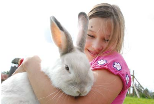
Фото внизу: Дети могут приласкать животных на ферме, отведать мстную кухню и насладиться вкусной едой на природе.