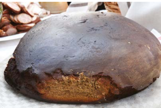
Фото справа в центре: Традиционный выпечной черный ржаной хлеб