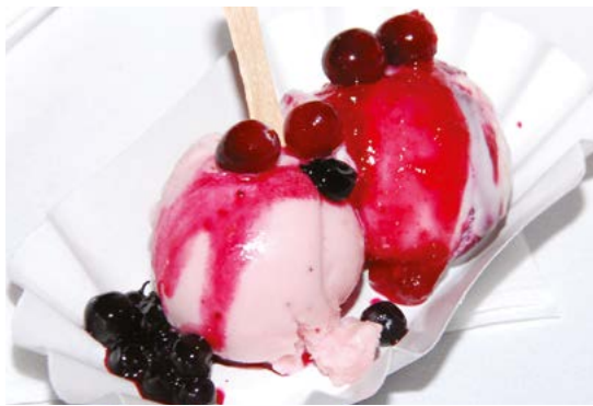
Фото внизу: Сладкое и пикантное мороженое в Скривери Салдеюм

Фото внизу слева: Дегустация мягкого козьего сыра на ферме