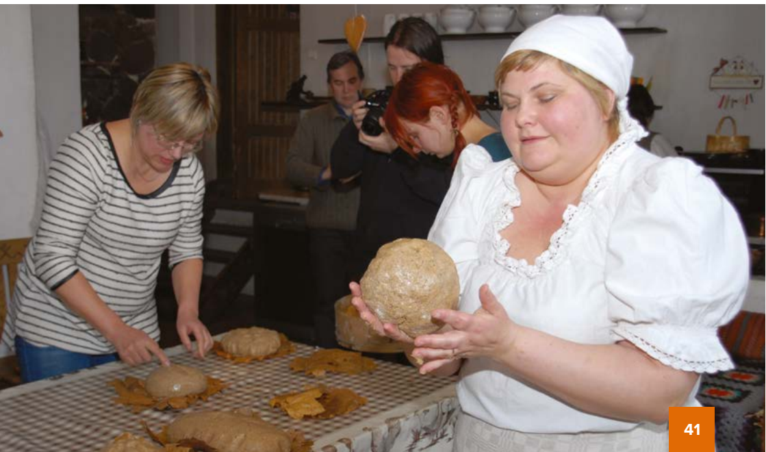
Фото внизу: Приготовление традиционного ржаного хлеба в пекарне «Донас» в Смилтене