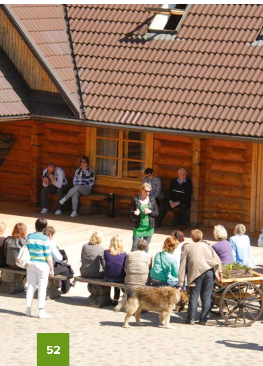
Фото из наших различных учебных туров. Работа в офисе и посещение достопримечательностей.

Первый день – это полный день тренировок в офисе Baltic Country Holidays в Риге. Мы обсудим все интересующие вас аспекты. Перерыв на обед. В следующие дни мы отправимся в учебный тур. Например, посетим различные типы мест для ночлега, открытые фермерские хозяйства или места с эко-ярлыком. На пути мы также осмотрим местные достопримечательности, а также обеспечим вам обед, ужин и ночлег. Вам также будут предоставлены услуги нашего гида. При необходимости мы можем продлить маршрут в Эстонию и Литву.