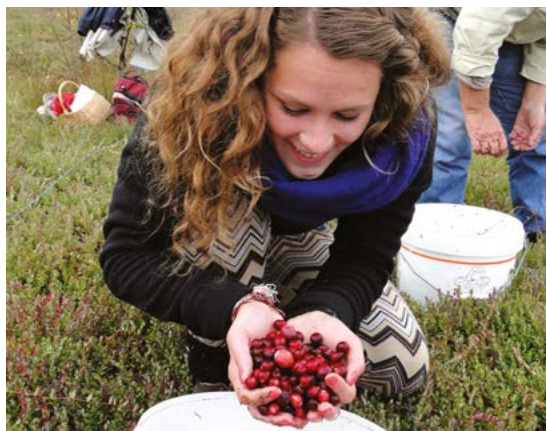
Фото на противоположной странице: Поход за грибами – почти что национальный вид спорта в Латвии

Фото в центре и внизу: Сбор культивированной клюквы на болоте и сбор растений для чаев