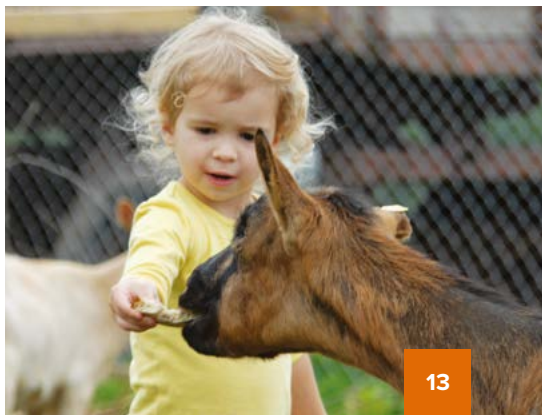
Фото внизу: Дети могут приласкать и покормить животных на ферме