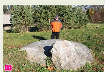
Чумной камень у церкви