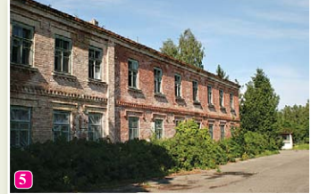
Здание бывшей Морской школы