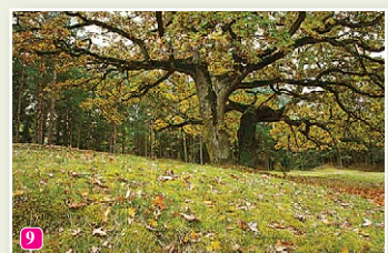
Вайде. Величавый дуб в Лажас