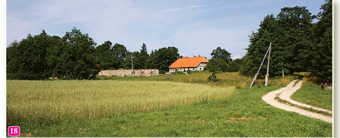
Жилое здание бывшей усадьбы пастора