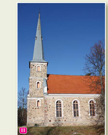
Мазирбская лютеранская церковь