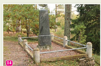
Памятник старому Тайзелю