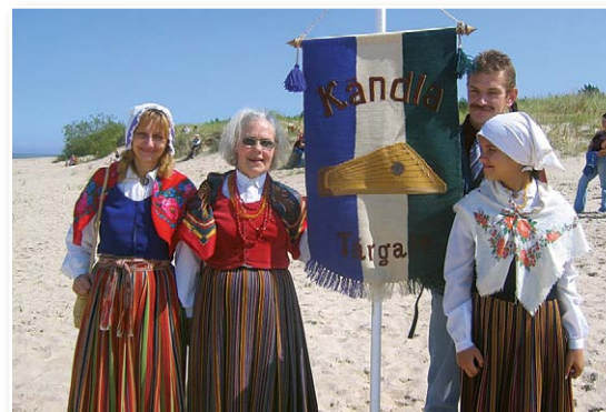
На морском берегу ливов у Мазирбе