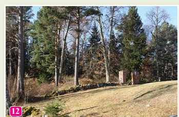
Холм древних захоронений