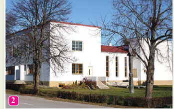
Народный дом ливов