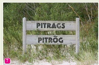
Знак Питрага на берегу моря