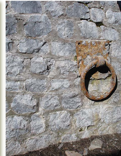
Каменная кладка Колкского маяка