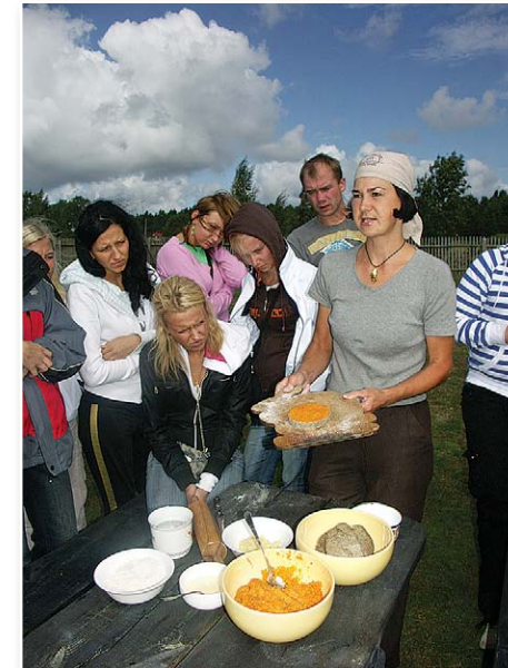
Скандрауши в «Ūši»