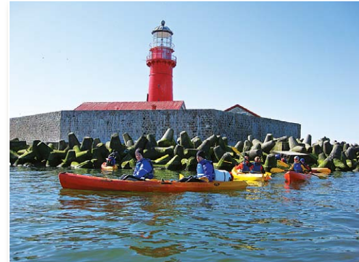
Путешественники на лодках у Колкского маяка