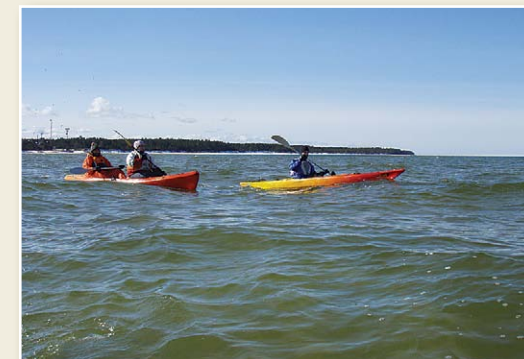
Путешественники на лодках к Колкскому маяку