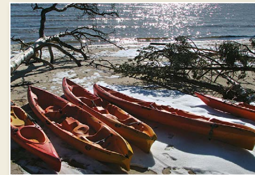
Лодки в Колкасаге