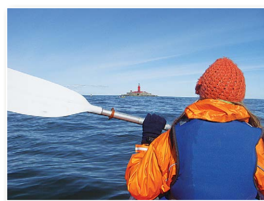
По дороге к Колкскому маяку

4 Колкский маяк – на искусственно созданном острове в море (остров создан в 1872 – 1875 гг.) изначально был построен деревянный маяк, огни на котором зажгли в июне 1875 года. Когда остров осел, здесь была построена теперешняя башня маяка, которая начала свою работу 1 июля 1884 года. Современный маяк находится на расстоянии 6 км (в момент постройки – 5 км) от Колкасага, в конце подводной песчаной мели. Еще на острове находится здание смотрителя маяка и несколько хозяйственных построек. Металлическая конструкция башни маяка высотой в 21 метр изготовлена в Санкт-Петербурге. С 1979 года маяк работает в автоматическом режиме.