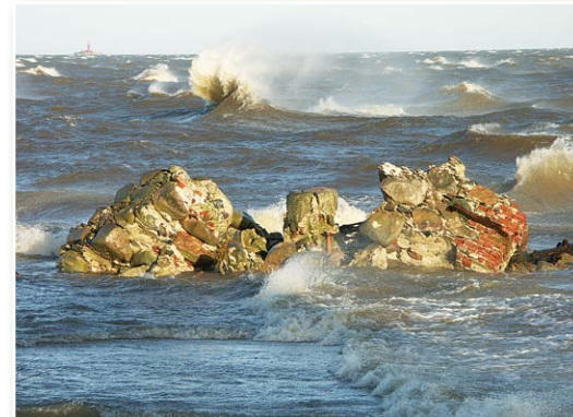
Шторм в Колкасаге