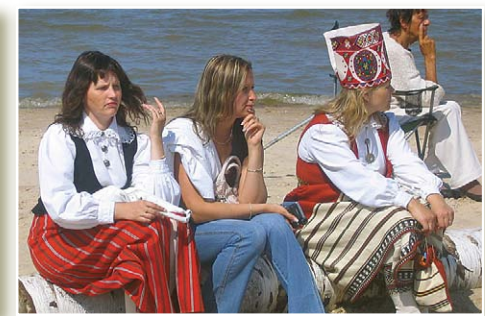
На морском берегу