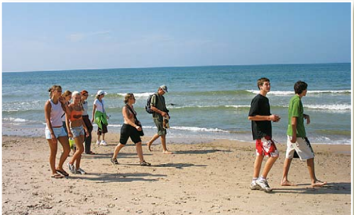
Поход вдоль моря

Маршрут лучше всего планировать таким образом, чтобы он был круговым и возвращался в исходную точку. Для того,