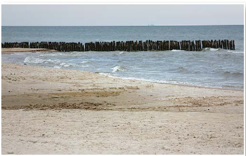
Море у Кошрага