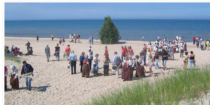
На побережье у Мазирбе