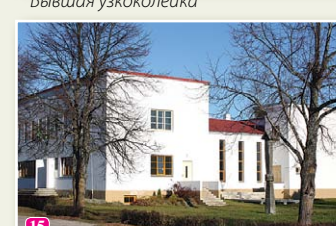
Народный дом ливов