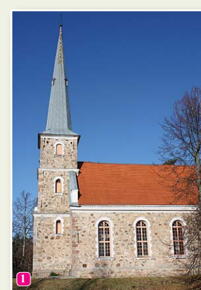
Мазирбская лютеранская церковь

22 Место бывшей корчмы – в Убеле, на обочине дороги Мазирбе - Цирсте.