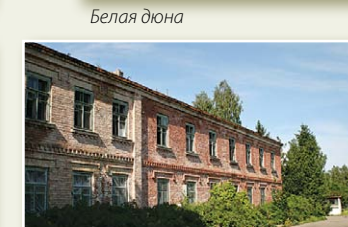
Здание бывшей Морской школы

В Слитерском национальном парке проложено еще несколько пешеходных, вело-, водо- и автотуристических маршрутов – ищите путеводители маршрутов на www.celotajs.lv и метки в природе!