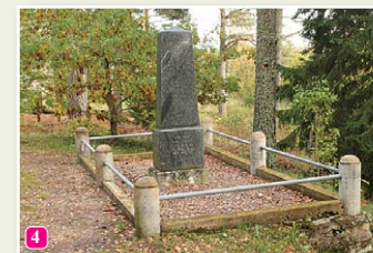
Памятник старому Тайзелю