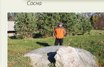
Чумной камень у церкви