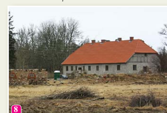
Жилое здание бывшей усадьбы пастора