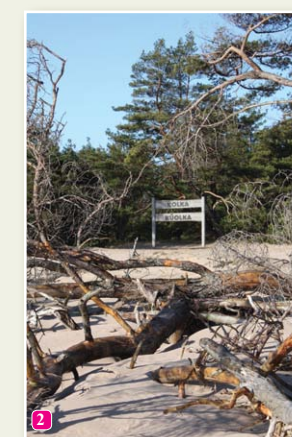
Берег у Колки