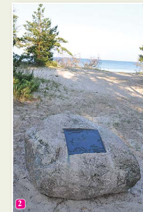
Камень – центр Европы