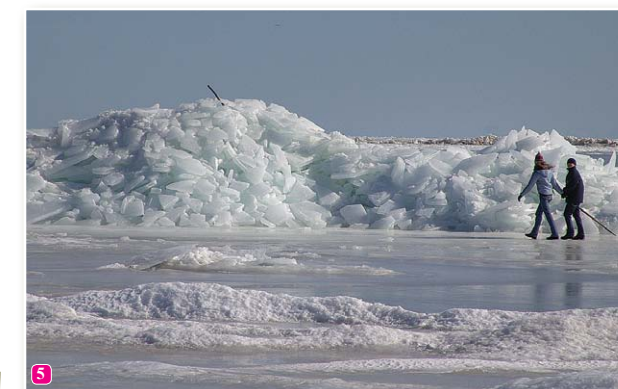
Зима на побережье Балтийского моря