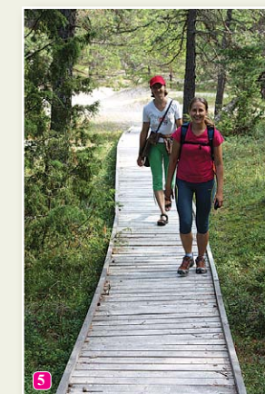
Природная тропа Колкских сосен