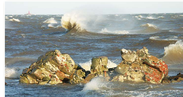
Шторм в Колкасаге