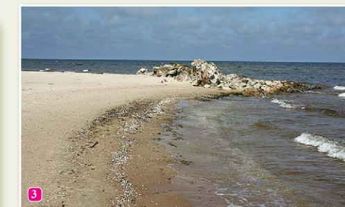
Старый Колкасагский маяк