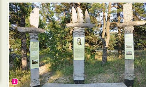
Информационные стенды, посвященные К.Валдемару