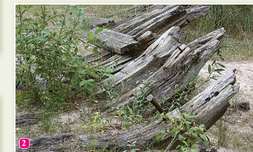
Остатки старого корабля