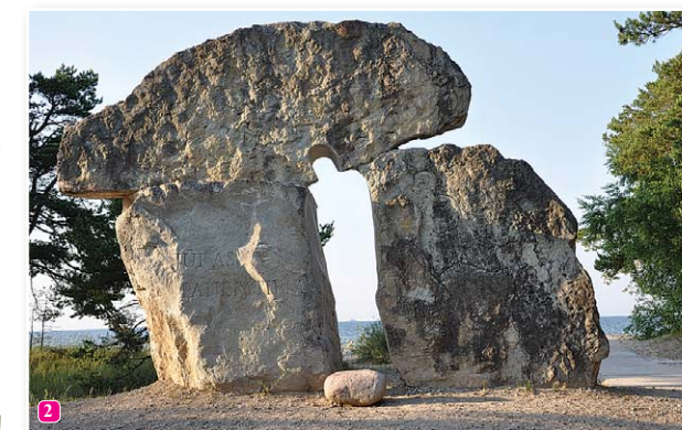
Памятник «Тем, кого забрало море»

6 Тир – на автостоянке рядом с тем местом, где берет свое начало природная тропа Колкских сосен, зоркий наблюдатель заметит современную заросшую широкую просеку, один конец которой заканчивается на морском побережье, а второй у дороги Колка – Вентспилс. Это место в советское время использовалось в военных целях – для обучения стрельбе.