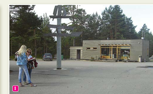
Колкасагский центр для посетителей