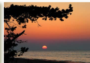
Закат солнца в Колкасаге