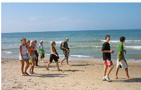
Gājieni gar jūru