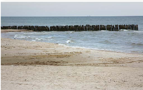
Jūra pie Košraga