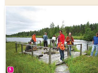
Pēterezera dabas taka