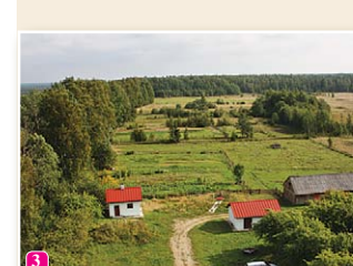
Skats no Šīteres bākas