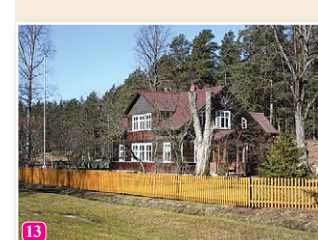
Purvziedu mājas Vaidē