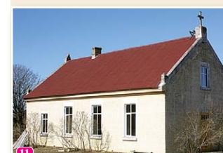
Pitraga baptistu baznīca