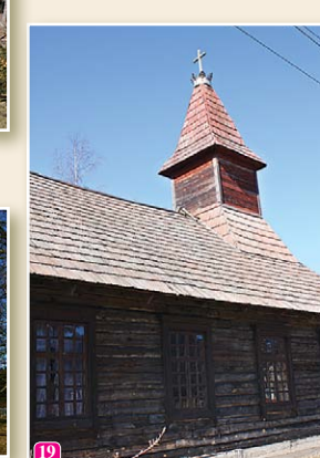
Kolkas katoļu baznīca