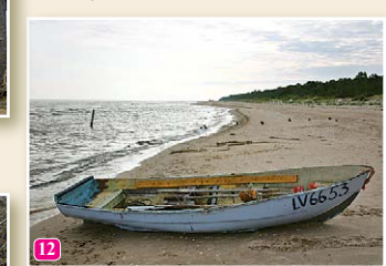
Jūra pie Saunaga