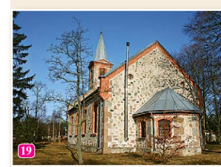
Kolkas luterāņu baznīca