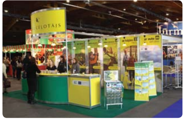
Izstādes stendā popularizējām projekta laikā paveikto Slīterē

http://www.celotajs.lv/cont/prof/proj/PolProp/Dokumenti/SCD_vadlinijas.pdf