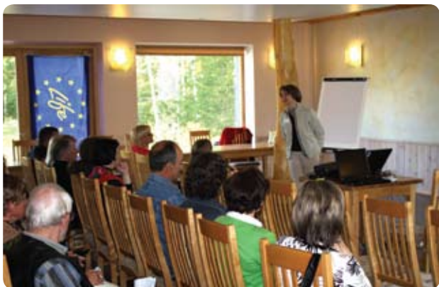
Tikšanās ar Slīterniekiem