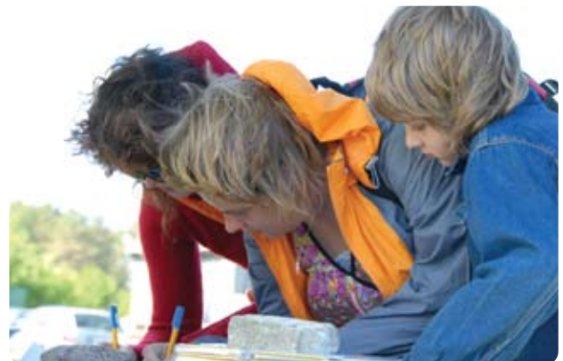
Apmeklētāju anketēšana Slīteres ceļotāju dienas laikā, 12. jūnijs, 2010.

Projekts pierādīja, ka Natura2000 pozitīvas atpazīstamības veidošanā galvenā nozīme ir pareizai un pozitīvai komunikācijai: dialoga veidošanai starp visām iesaistītajām nozarēm, kā arī Natura2000 teritoriju iedzīvotāju iesaistīšanai un uzrunāšanai, skaidrojot dabas vērtības, pamatojot to saudzēšanas nepieciešamību un parādot pareizas rīcības piemēru videi draudzīgā un ekonomiski izdevīgā saimniekošanā.