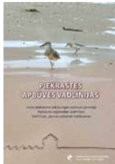
Piekrastes apbūves vadlīnijas ir padomdevēju būvētājiem

Kultūrvēsturiskā vide ir ne tikai svarīgs tūrisma resurss, bet arī apkārtējās ainavas un vides sastāvdaļa. Ir nepieciešams saglabāt un pilnveidot autētiskos apbūves principus, veidojot harmonisku vidi, ne-pieļaujot aizsargājamo dabas un kultūrvēsturisko vērtību izzušanu. Vēloties atjaunot un attīstīt vienotu piekrastes vizuāli emocionālo tēlu, ievērojot reģionālās un lokālās teritoriju īpatnības sadarbībā ar Latvijas vadošajiem arhitektiem, Kultūras un Vides un Reģionālās attīstības ministrijām izstrādājām „Piekrastes apbūves vadlīnijas”, kas ir viens no projekta vides politikas un pārvaldības priekšlikumiem.