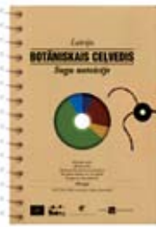
Ceļvedim ir ērts kabatas formāts, ņemams līdz dabā

Lai skaidrotu un popularizētu bioloģisko daudzveidību Natura2000 teritorijās, sastādījām botānisko ceļvedi – sugu noteicēju. Izdevuma galvenais mērķis ir ikvienam palīdzēt saskatīt un atpazīt tās augu un sēņu sugas, kas atrodas mums visapkārt, kā arī sniegt interesantus faktus par tām saistībā ar izmantošanu gan pagātnē, gan mūsdienās, leģendām un nostāstiem, utt.