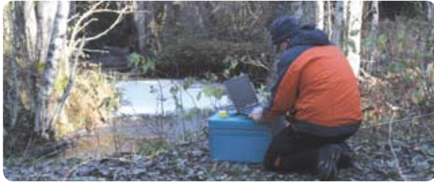
Elektroniskā skaitītāja datu nolasišana Slīteres nacionālajā parkā