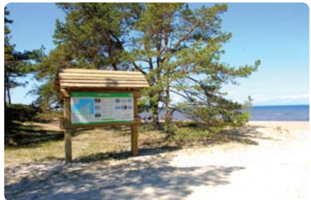
Informācijas stends Slīteres nacionālajā parkā

http://www.celotajs.lv/cont/prof/proj/PolProp/Dokumenti/Outdoor_panels_LV.pdf