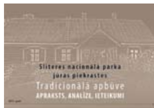
Tradicionālā apbūve veido kvalitatīvu vidi un ainavu, nemazina bioloģisko daudzveidību

Dokuments Slīteres nacionālā parka jūras piekrastes tradicionālā apbūve.