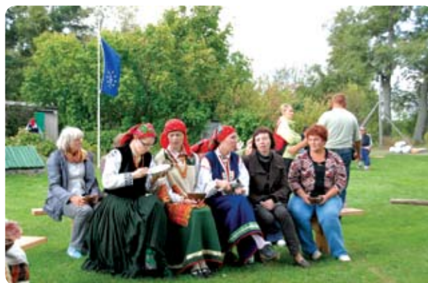
Publiskās diskusijas dalībnieki Papes Ķonu ciemā

3) 22.03.2011 Baltijas Dabas tūrisma konference kopā pulcināja 258 dalībniekus no 18 valstīm. Konferences programmas 1. darba sesija tika veltīta dabas aizsardzības politikas jautājumiem. Lai panāktu projekta atpazīstamību un interesi par tā rezultātiem ārpus Latvijas, prezentējām projektu 13 konferencēs, semināros un citos pasākumos, veidojot sadarbību ar Natura2000 teritoriju apsaimniekotājiem un projektiem citās valstīs – Vācijā, Briselē, Igaunijā, Serbijā, Lielbritānijā, Somijā, Itālijā.