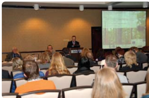
Projekta prezentācija Dabas tūrisma konferencē 22.03.2011.