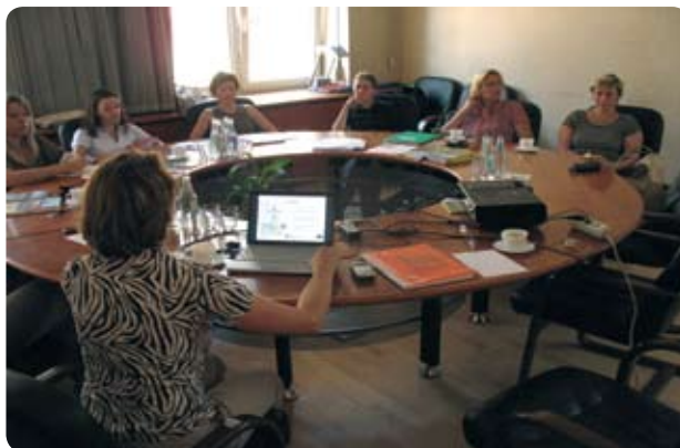
Politiskās uzraudzības grupas tikšanās