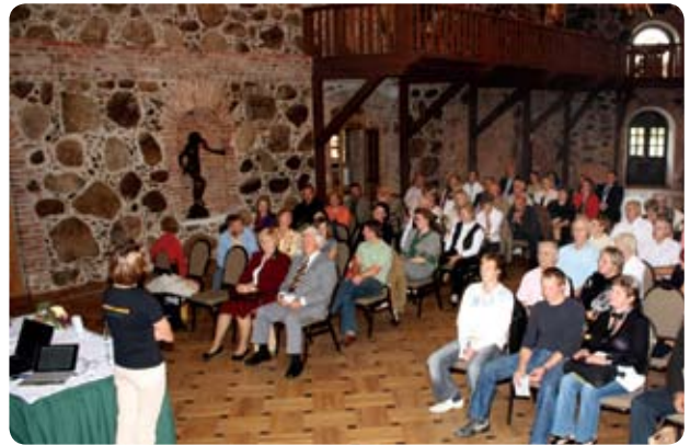
Lauku tūrisma uzņēmēju seminārs