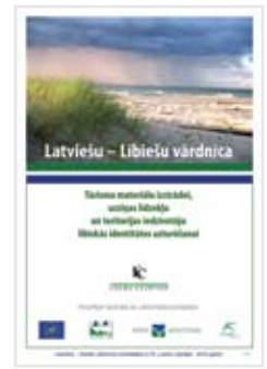
Latviešu – lībiešu vārdnīca palīdz saglabāt autentisko kultūrvērtību SNP un piesaistīt apmeklētājus

Slīteres NP teritorija ir viena no mazākās tautas pasaulē – lībiešu - lokalizācijas vietām, tādēļ ir izstrādāta šī mazā, uz ilglaicīga tūrisma attīstību orientētā latviešu – lībiešu valodas skaidrojošā vārdnīca, kas ieteicama marketinga tūrisma materiālu izstrādei, uzziņas līdzekļu un teritorijas iedzīvotāju lībiskās identitātes uzturēšanai. Vārdnīca sniedz tulkojumu šodienas sadzīvē lietotajiem latviešu vārdiem – mājvārdiem un vietu nosaukumiem, ēdieniem, svētkiem u.c. Ieteikums veidot vārdnīcu ir vietējo iedzīvotāju iniciatīva. Lībiskais tulkojums tika izmantots gan uzstādot norādes, gan stendu informācijā, gan tūrisma produktos un maršrutos, gan Slīteres nacionālā parka ceļvedī.