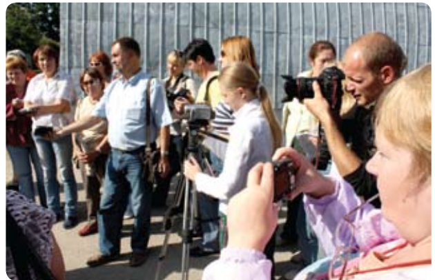
Žurnālisti projekta preses braucienā