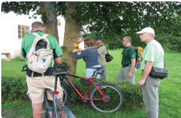
Maršrutu marķēšanas seminārs dabā

Lai palīdzētu ceļotājiem orientēties apvidū, nepieciešams atzīmēt maršrutus dabā. Līdz šim brīdim Latvijā nebija vienotas maršrutu marķēšanas sistēmas, kā arī pārsvarā virziens maršrutos tika norādīts ar speciāli izgatavotām