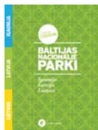
Baltijas nacionālo parku ceļvedis izdots latviešu un angļu valodās

Baltijas nacionālo parku ceļvedis – unikāls izdevums, pirmais ceļvedis, kas apkopo informāciju par visiem 14 Baltijas nacionālajiem parkiem – Natura2000 teritorijām vienkopus. Tā saturs balstīts uz Lauku ceļotāja speciālistu veiktajiem apsekojumiem dabā, gan testējot parku piedāvātos tūrisma produktus, gan tiekoties ar parka administrāciju vadītājiem un speciālistiem, gan apmeklējot tūrisma objektus.