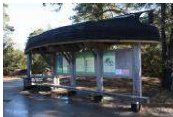
2.2.att. Informācijas stends Kolkas ragā

Parkā izvietoti 9 trīsdalīgie informācijas stendi apmeklētājiem, kas izgatavoti pēc īpaši aizsargājamo dabas teritoriju vienotā stila (SNP administrācijas ieguldījums). Tajos izvietota informācija pēc šāda principa: vispārīga informācija par parku, par SNP administrācijas izveidotiem tūrisma objektiem parkā (skat. att. 2.1.1.) un detalizēta informācija par objektu pie kā izvietots stends. Informācija ir gan latviešu, gan angļu valodās. SNP administrācijas izveidotajās un uzturētajās dabas takās ir izvietota informatīva informācija par tajās redzamajām dabas un kultūrvēstures vērtībām. Velomaršruts Kolka – Mazirbe ir marķēts ar koka stabiņiem ar velosipēda piktogrammu uz zaļa fona (skat. att.2.1.3.). Visu iepriekš minēto informatīvo infrastruktūru parkā uztur Slīteres nacionālā parka administrācija.