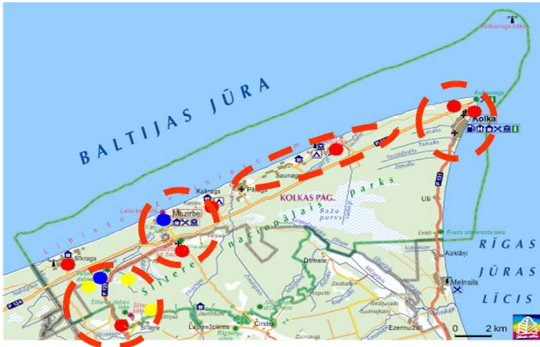
2.att. Tūrisma objektu koncentrēšanās zonas Slīteres nacionālajā parkā

Slīteres nacionālajā parkā šobrīd esošie tūrisma objekti koncentrējas četrās zonās: Šlīteres bākas, Mazirbes, Kolkas raga un Kolkas apkaimēs. Slīteres nacionālajā parka teritorijā atrodas arī šobrīd populārākais Ziemeļkurzemes tūrisma objekts Kolkasrags - ar vairāk kā 50 000 apmeklējumiem 2008. gadā 5 .