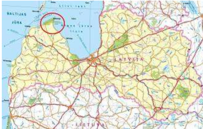
1.att. Slīteres nacionālā parka atrašanās vieta Latvijā