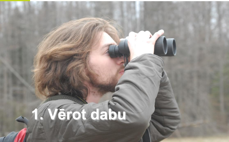
1. Vērot dabu