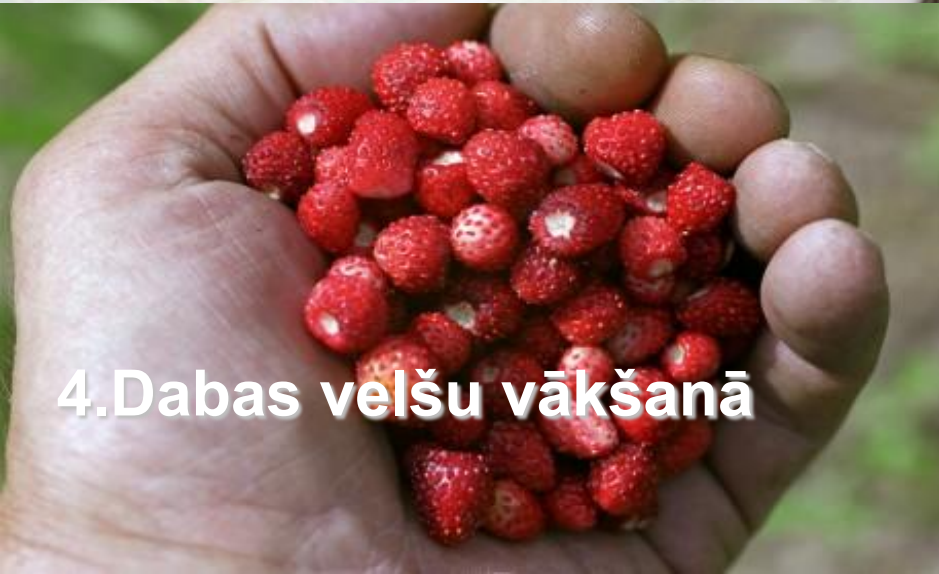
4. Dabas velšu vākšanā