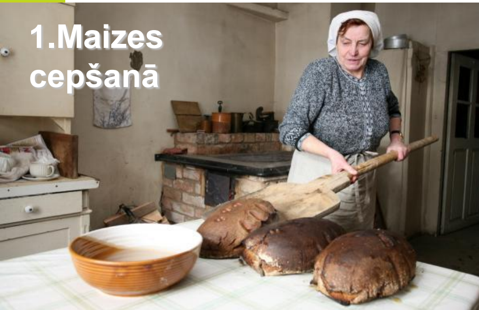
1. Maizes cepšanā