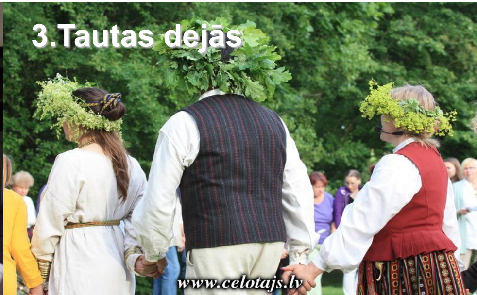
3. Tautas dejās