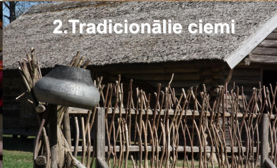
2. Tradicionālie ciemi