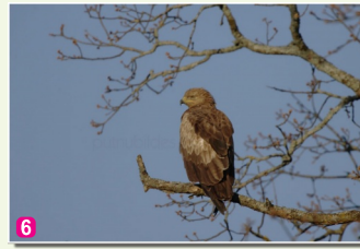
6 Mazais ērglis Aquila pomarina