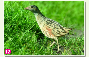
12 Grieze Crex crex