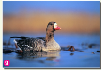
9 Baltpiers zosis Anser albifrons