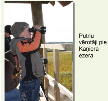
Putnu vērotāji pie Kaņiera ezera