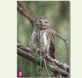
5 Apodziņš Glaucidium passerinum