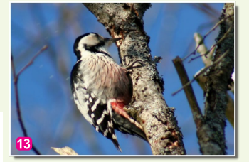
13 Baltmugurdenis Dendrocopos leucotos

Apzīmējumi: ■■■■ - suga novērojama regulāri, ■■■■■ - suga novērojama neregulāri, * - dzirdamas šo sugu balsis