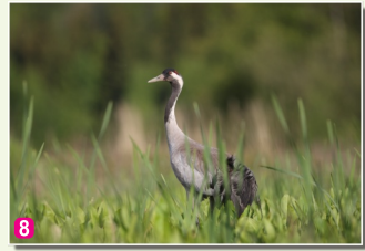
8 Dzērve Grus grus