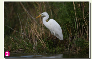
2 Baltais gārnis Egretta alba