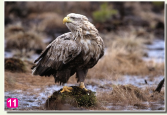
11 Jūras ērglis Haliaeetus albicilla