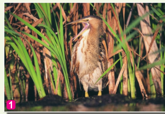
1 Lielais dumpis Botaurus stellaris

13 Baltmugurdenis – Ķemeru nacionālā parka simbols, kam īsti pa prātam ir šeit sastopamie dabiskie meži ar visiem tiem raksturīgajiem elementiem – dažāda vecuma augošiem kokiem, sausokņiem un kritālām. Tieši šī apstākļa dēļ ĶNP par mājvietu izvēlējušies arī visu pārējo Latvijā sastopamo dzeņveidīgo sugu pārstāvjus.