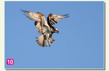
10 Zivjērglis Pandion haliaeetus