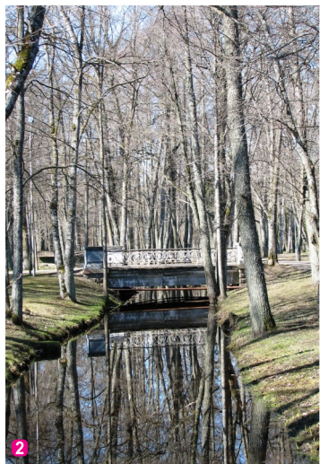
2 Tilts pāri Veršupītei