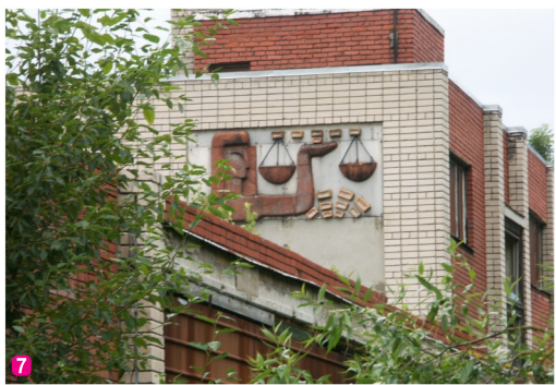
7 Bijusī aptiekas ēka