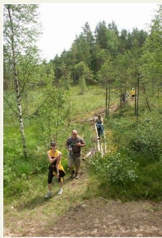
Otrā purva šķērsošanas vieta