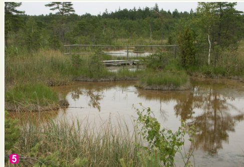
5 Raganu purvs