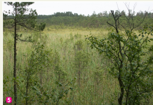
5 Raganu purvs