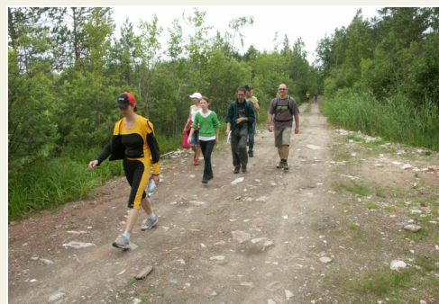
Ķemeru - Antiņciema ceļš