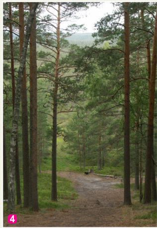
Skats uz Zaļo purvu no Zaļās kāpas