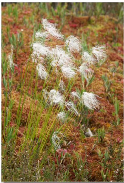
Alpu mazmeldrs ( Trichophorum alpinum )