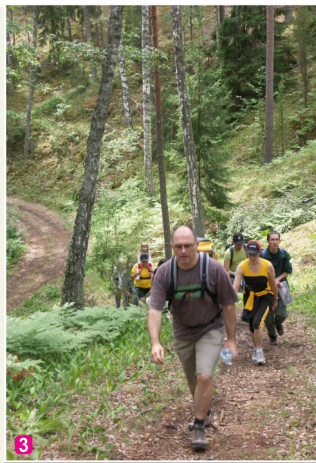
3 Zaļās kāpas valnis

9 Ķemeru skolas ēkas būvniecība pabeigta 1934. gadā (arhitekts K. Cināts). Tā ir viena no nedaudzajām skolu ēkām Latvijā, kur saglabājusies vēsturiski vērtīgs interjers un eksterjers – t.sk. alegoriski tēli uz tās fasādes.