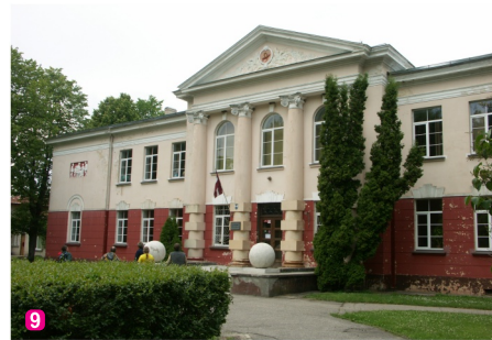
9 Ķemeri skola

Ķemeri nacionālajā parkā ir izveidoti vairāki pārgājēju, velo, ūdens un autotūrisma maršruti – meklējiet maršrutu lapas www.celotajs.lv un atzīmes dabā!