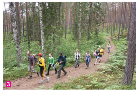
3 Zaļā kāpa