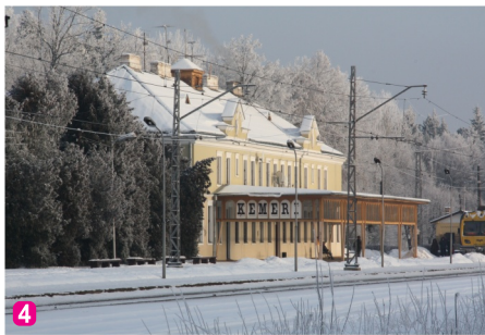
Ķemeri dzelzceļa stacijas ēka

Ķemeri nacionālajā parkā ir izveidoti vairāki pārgājēju, velo, ūdens un autotūrisma maršruti – meklējiet maršrutu lapas www.celotajs.lv un atzīmes dabā!