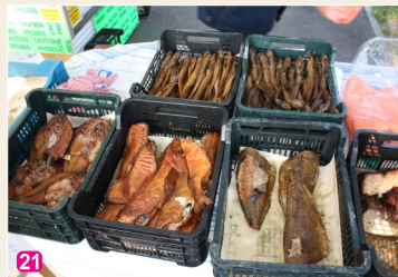
Ragaciema Zivju tirgus