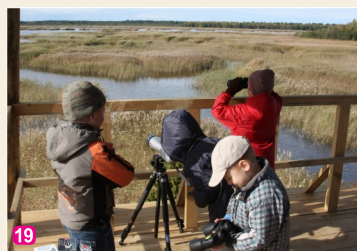
Putnu vērošanas tornis Kaņiera ezera krastā