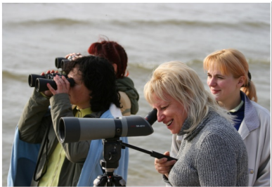
Putnu vērošana piekrastē

Der zināt! Putnu vērošanai nepieciešama laba optika – binoklis vai putnu vērošanas teleskops. Nevienu no maršrutam tuvākajām vietām optiku nepiedāvā īrēt, tāpēc būtiski pagādāt to pašiem. Ar optiku īpaši jāuzmanās uz Ainažu mola, kur akmeņi reizēm ir slideni vai gāzelējas. Katrs pats ir atbildīgs par savu un savu bērnu drošību maršruta veikšanas laikā!