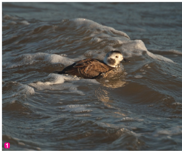
Kākaulis Clangula hyemalis

Neatliekamās palīdzības dienestu tālrunis: 112