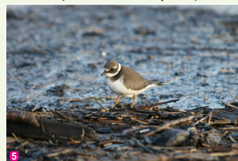
Smilšu tārtiņš Charadrius hiaticula jaunais putns