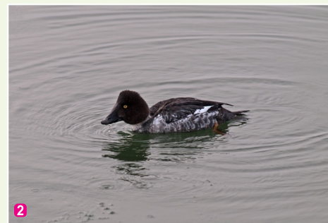
Gaigala Bucephala clangula mātiņa