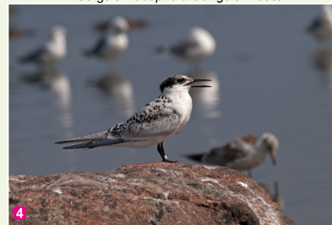
Cekulzīriņš Sterna sandvicensis jaunais putns