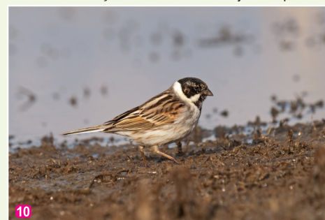
Niedru stērste Emberiza schoeniclus tēviņš vasaras tērpā