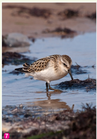
Trulītis Calidris minuta