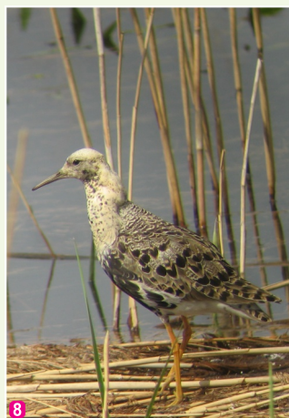
Gugatnis Philomachus pugnax tēviņš kāzu tērpā