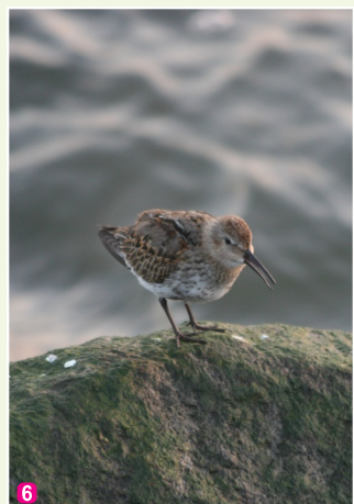
Parastais šņibītis Calidris alpina alpina