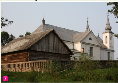
Kaunatas Vissvētās Jaunavas Marijas Romas katoļu baznīca