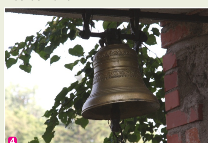
Zvans pie ieejas Zosnas Sv. Erceņģeļa Miķeļa Romas katoļu baznīcā