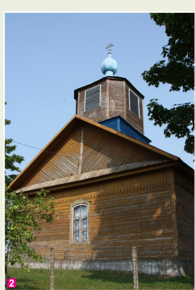
Lipušku vecticībnieku lūgšanu nams