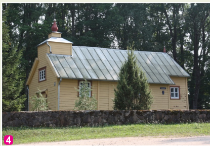
Zosnas Sv. Erceņģeļa Miķeļa Romas katoļu baznīca