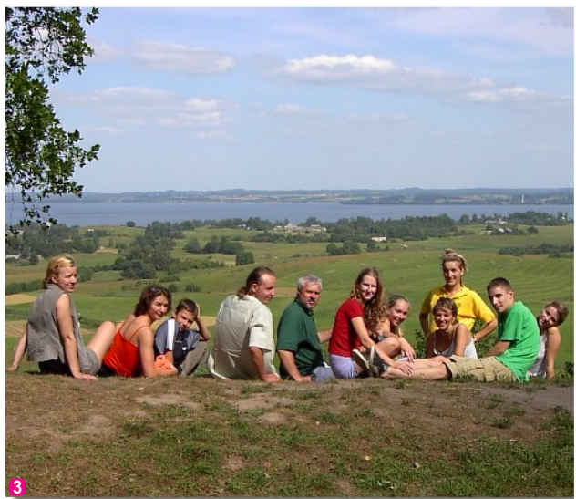
Skats uz Rāznas ezeru no Mākoņkalna

Neatliekamās palīdzības dienesta tālrunis: 112