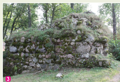
Livonijas ordeņa pils aizsargmūra fragments