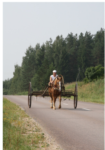
Bieži redzams transporta līdzeklis Latgalē

Citus aktīvā tūrisma maršrutus meklējiet www.celotajs.lv !