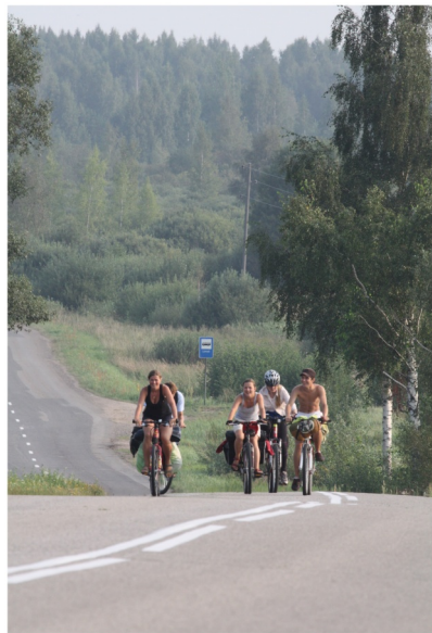
Velobraucēji Rāznas nacionālajā parkā