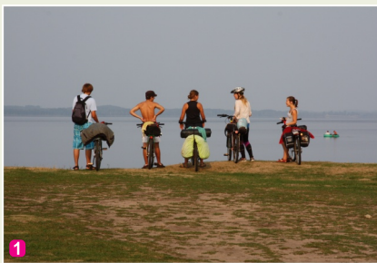
Velobraucēji Rāznas ezera krastā

9 Z/s "Rudo kumeļu pauguri", kur saimnieko vieni no Latgales rikšotāju šķirnes atjaunošanas entuziastiem, var iepazīt Latgales zirgkopības tradīcijas. Saimniecībā iespējams uzklaut saimnieku stāstījumu, aplūkot senu "zirglietu" kolekciju un doties izjādē zirga mugurā vai Latgalei raksturīgā pajūgā, divjūgā vai trijjūgā. Pieredzējuša instruktora vadībā saimniecībā iespējams apgūt pajūgu vadīšanas un jāšanas pamatus. Bērniem interesanta ir mājdzīvnieku apskate, veselīgas pārtikas cienītājiem - lauku produktu degustācija.