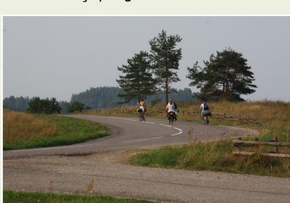
Velobraucēji Rāznas nacionālajā parkā