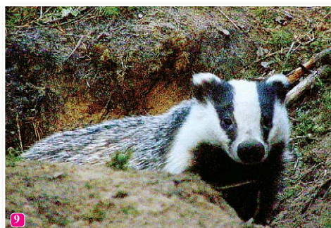
9 Āpsis Meles meles pieder sermuļu dzimtai. Lielāko gada daļu tas ir izteikts nakts dzīvnieks, bet vasaras sākumā, kad alās to gaida bērni, tas sastopams arī dienā.