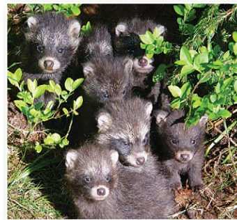
Jenotsuņa kučēni Nyctereutes procyonoides