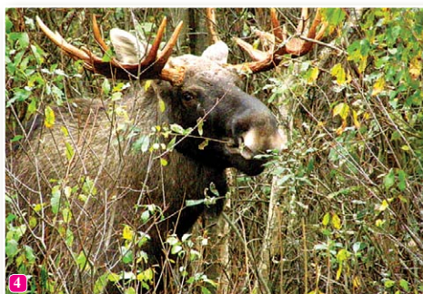
4 Alnis Alces alces – lielākais briedis pasaulē. Slīteres NP ar purviem un mežiem ir ideāli piemērota dzīvesvieta šim milzīnim. Bieži vien tas ieraugāms ceļmalās.