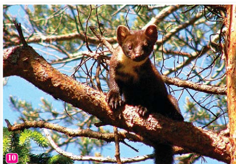
10 Meža cauna Martes martes vasaras vidū riesto un ir novērojama dienā. Caunu mātītes ir vieglākas kā tēviņi, tāpēc biežāk izmanto koku vainagus.