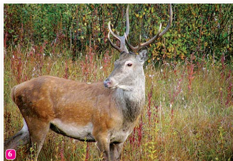
6 Staltbriedis Cervus elaphus – Slīteres NP skaitliski lielākā briežu populācija. Rieta laikā dzirdamā buļļu aurošana, ragu klabēšana, tiem cīnoties, ir patiesi neaizmirstams piedzīvojums ikvienam dabas vērotājam.