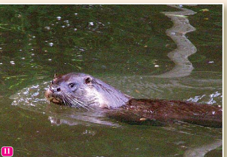
11 Ūdrs Lutra lutra barību rod foreļu strautos. Vasarā tas ir aktīvs cauru diennakti.