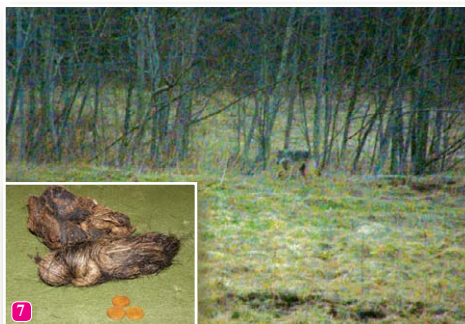
7 Vilku Canis lupus sastapt izdodas vien retajam tā slēptā dzīvesveida dēļ. Vilku ekskrementi Slīteres nacionālajā parkā ieraugāmi daudz biežāk kā pats zvērs. Šā veidojuma autors mīlojies ar mežacūku.