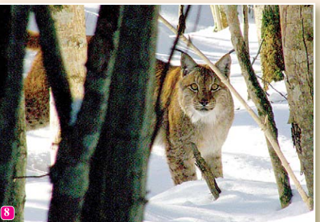
8 Lūsis Lynx lynx ir ļoti uzmanīgs dzīvnieks. Tas ir vienīgais savvaļā sastopamais kaķu dzimtas pārstāvis Latvijā. Tas, ka lūsis laupījumam uzbrūk no koka, ir izdomājums. Lūsis medī uz zemes.