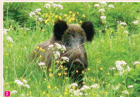
2 Meža cūka Sus scrofa – viens no biežāk sastopamajiem lielajiem zīdītājiem. Pavasari barojas atklātās vietās un ir ērti novērojama.