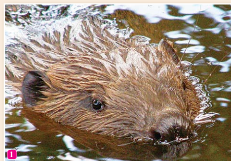
1 Bebrs Castor fiber – plaši izplatīts Slīteres nacionālā parka ūdenstečēs, ir suga, kura aktīvi pārveido vidi. Iespējams vērot un dzirdēt to sarunas no dažu metru attāluma.