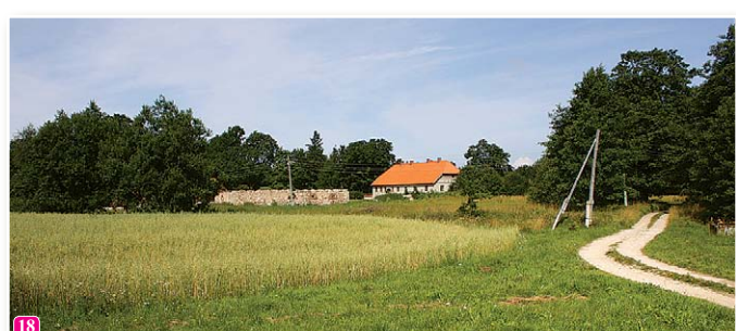
Bijušās mācītājmuižas dzīvojamā ēka