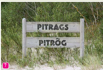
Pitraga zīme jūras krastā