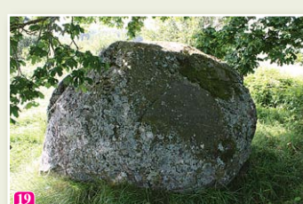
Lielais Mēra akmens