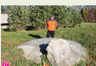
Mēra akmens pie baznīcas