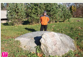
Mēra akmens pie baznīcas