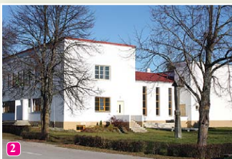
Lībiešu tautas nams