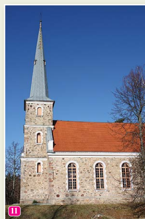
Mazirbes luterāņu baznīca.