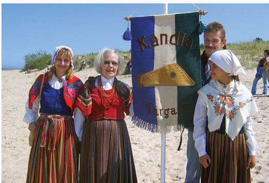
Lībieši jūras krastā pie Mazirbes