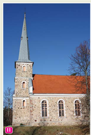
Mazirbes luterāņu baznīca.