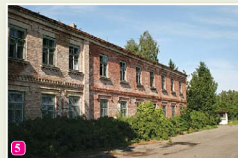
Bijušās Jūrskolas ēka