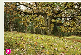
Vaide. Dižozols Lāžās