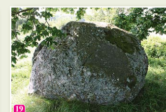
Lielais Mēra akmens

Slīteres nacionālajā parkā ir izveidoti vēl vairāki pārgājienus, velo, ūdens un auto tūrisma maršruti – meklējiet maršrutu lapas www.celotajs.lv un atzīmes dabā!