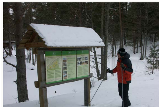
Pie informācijas stenda Vaidē