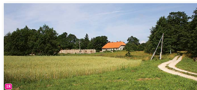
Bijušās mācītājmuizas dzīvojamā ēka