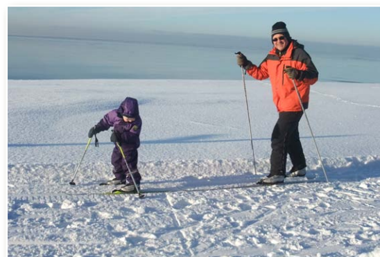
Slēpotāji jūras krastā