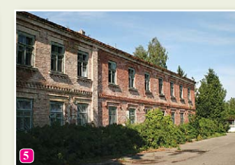
Bijušās Jūrskolas ēka