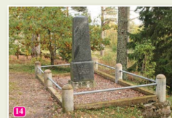
Vecā Taizeļa piemineklis