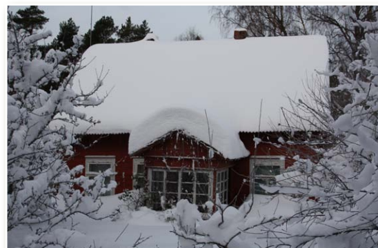
Starp Vaidi un Saunagu