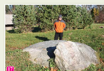
Mēra akmens pie baznīcas