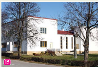
Lībiešu tautas nams