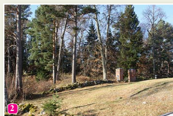
Veco kapu kalniņš