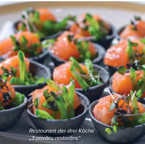
Restaurant der drei Köche „3 pavāru restorāns“

Das Verständnis über eine köstliche und gesunde Mahlzeit hat sich im Laufe der Zeit geändert. Die traditionellen Rezepte werden dem heutigen Leben angepasst, indem der Fettgehalt verringert und dadurch die Struktur des Essens verändert wird: Speisen werden leichter. In Restaurants werden den Gästen in überraschenden Kombinationen vorbereitete Naturgeschenke aus den Feldern, Wiesen, Wäldern und Gewässern von Lettland angeboten. Diese Produkte werden als verschiedene Speisen serviert, die meistens saisonbedingt sind.