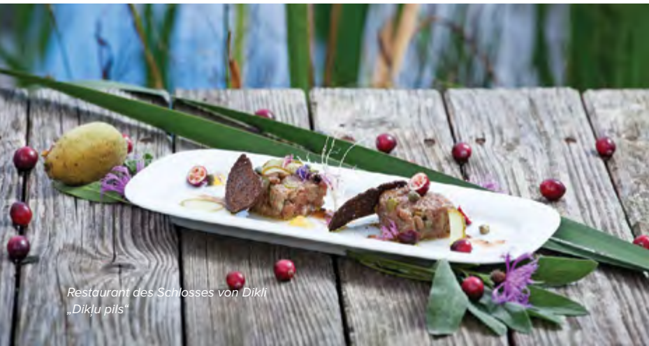
Restaurant des Schlosses von Dīķi „Dīķu pils“

Die besten Köche und Konditoren bereiten jede Speise fast wie ein wohlüberlegtes Kunstwerk vor: Sie spielen nicht nur mit feinen Duft- und Geschmacksnuancen, sondern auch mit Farben und Faktoren. Jede Speise ist wie ein Erlebnis in der Welt des lettischen Geschmacks.