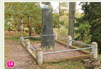
Das Denkmal vom alten Tāizelis