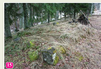
Das Grab vom Werwolf