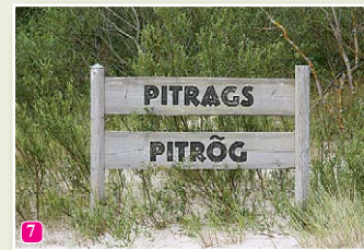
Das Zeichen vom Pitrags am Strand