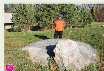
Die Peststeine bei der Kirche