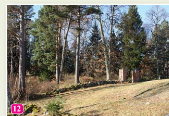
Das alte Grabhügel