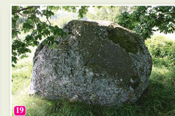
Der große Peststein