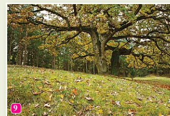
Vaide. Die markante Eiche in Lāzas