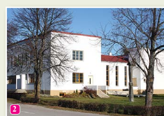
Das livische Volkshaus