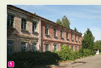
Das Gebäude der ehemaligen Meeresschule