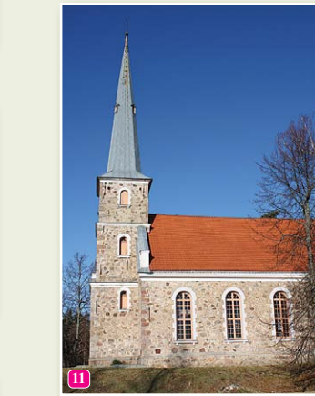
Die lutherische Kirche von Mazirbe