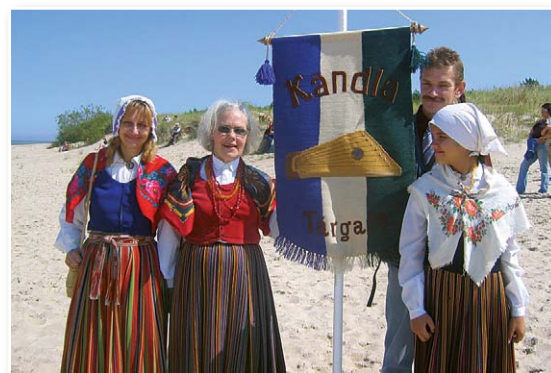
Live am Meeresstrand bei Mazirbe