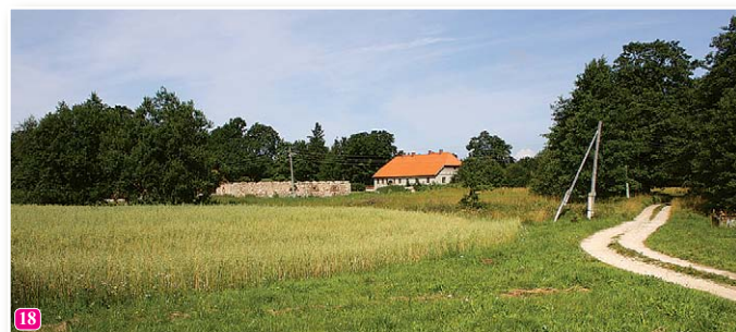
Das Wohnhaus vom ehemaligen Pfarrhof