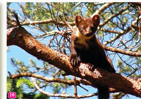
10 Meža cauna Martes martes vasaras vidū riesta un ir novērojama dienā. Caunu mātītes ir vieglākas kā tēviņi, tāpēc biežāk izmanto koku vainagus.