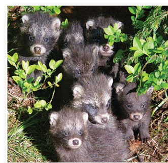
Jenotsuņa kucēni Nyctereutes procyonoides