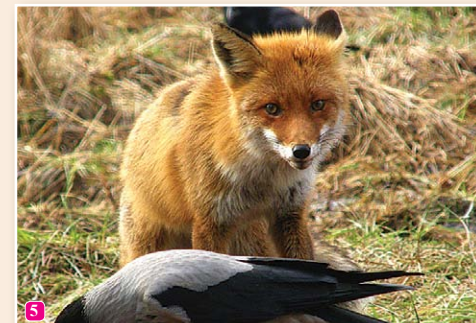
5 Lapsa Vulpes vulpes pavasarī novērojama peļojot laukos un pļavās. Tai ir lieliski attīstīta oža, dzirde un redze.