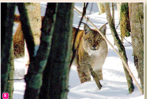
8 Lūsis Lynx lynx ir ļoti uzmanīgs dzīvnieks. Tas ir vienīgais savvaļā sastopamais kaķu dzimtas pārstāvis Latvijā. Tas, ka lūsis ļaujumiņam uzbrūk no koka, ir izdomājums. Lūsis medī uz zemes.