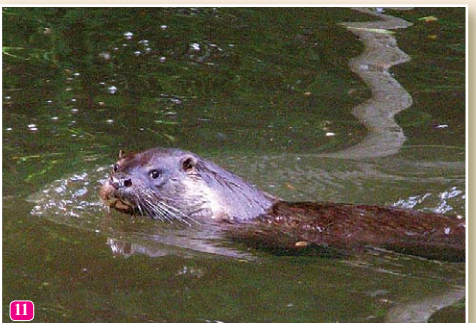
11 ūdrs Lutra lutra barību rod foreļu strautos. Vasarā tas ir aktīvs cauru diennakti.