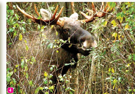
4 Alnis Alces alces – lielākais briedis pasaulē. Slīteres NP ar purviem un mežiem ir ideāli piemērota dzīvesvieta šim milzenim. Bieži vien tas ieraugāms ceļmalās.