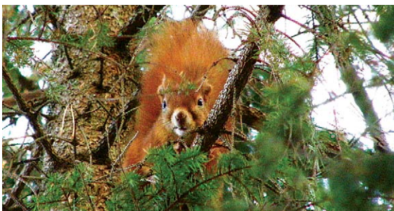
Vāvere Sciurus vulgaris

Zvēru vērošana iespējama tikai SNP gida pavadībā, nelielās grupās (1 – 5 cilvēki, ieteicamais vecums: 15 gadi un vairāk), izmantojot īpašus torņus un pavadot tajos vairākas stundas – šī iemesla dēļ zvēru vērošana paredzēta siltā laikā (temperatūra virs 0°C). Nepieciešami ūdensnecaurīdīgi, ērti apavi išanai, silts un „klus” apģērbs (nečaukst, nešvīkst, nav spilgtās krāsās). Tūres laikā paredzēts noiet aptuveni 2km. Ieteicams ņemt līdzī binokli, fotokameru, našķus un bezalkoholisku dzērienu. Pieteiktis zvēru vērošanas tūrēm nepieciešams vismaz divas nedēļas iepriekš: "Lauku ceļotājs", tel.: 67617600, lauku@celotajs.lv