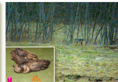
7 Vilku Canis lupus sastapt izdodas vien retajam tā slēptā dzīvesveida dēļ. Vilku ekskrementi Slīteres nacionālajā parkā ieraugāmi daudz biežāk kā pats zvērs. Šā veidojuma autors mīlojies ar mežacūku.