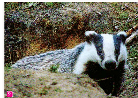
9 Āpsis Meles meles pieder sermuļu dzimtai. Lielāko gada daļu tas ir izteikts nakts dzīvnieks, bet vasaras sākumā, kad aļās to gaida bērni, tas sastopams arī dienā.