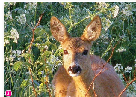
3 Stirna Capreolus capreolus – mazākais no Latvijā sastopamajiem briežiem. Stirnas Slīterē medī lūši un vilki.