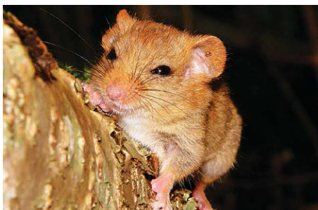
Lazdu susuris Muscardinus avellanarius

Neatliekamās palīdzības dienestu tālrunis: 112