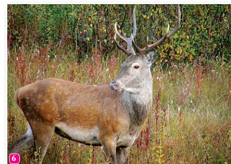
6 Staltbriedis Cervus elaphus – Slīteres NP skaitliski lielākā briežu populācija. Riesta laikā dzirdamā bulļu aurošana, ragu klabšana, tiem cīnoties, ir patiesi neizmirstams piedzīvojums ikvienam dabas vērotājam.