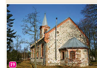
Kolkas luterāņu baznīca