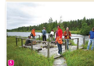
Pēterezera dabas taka