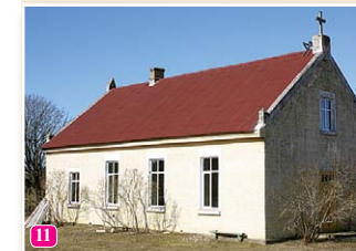
Pitraga baptistu baznīca