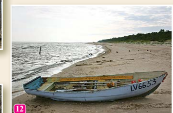
Jūra pie Saunaga