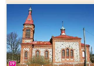
Kolkas pareizticīgo baznīca