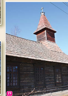
Kolkas katoļu baznīca