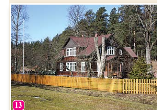
Purvziedu mājas Vaidē