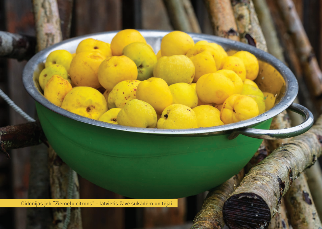
Cidonijas jeb "Ziemeļu citrons" - latvietis žāvē sukādēm un tējai.