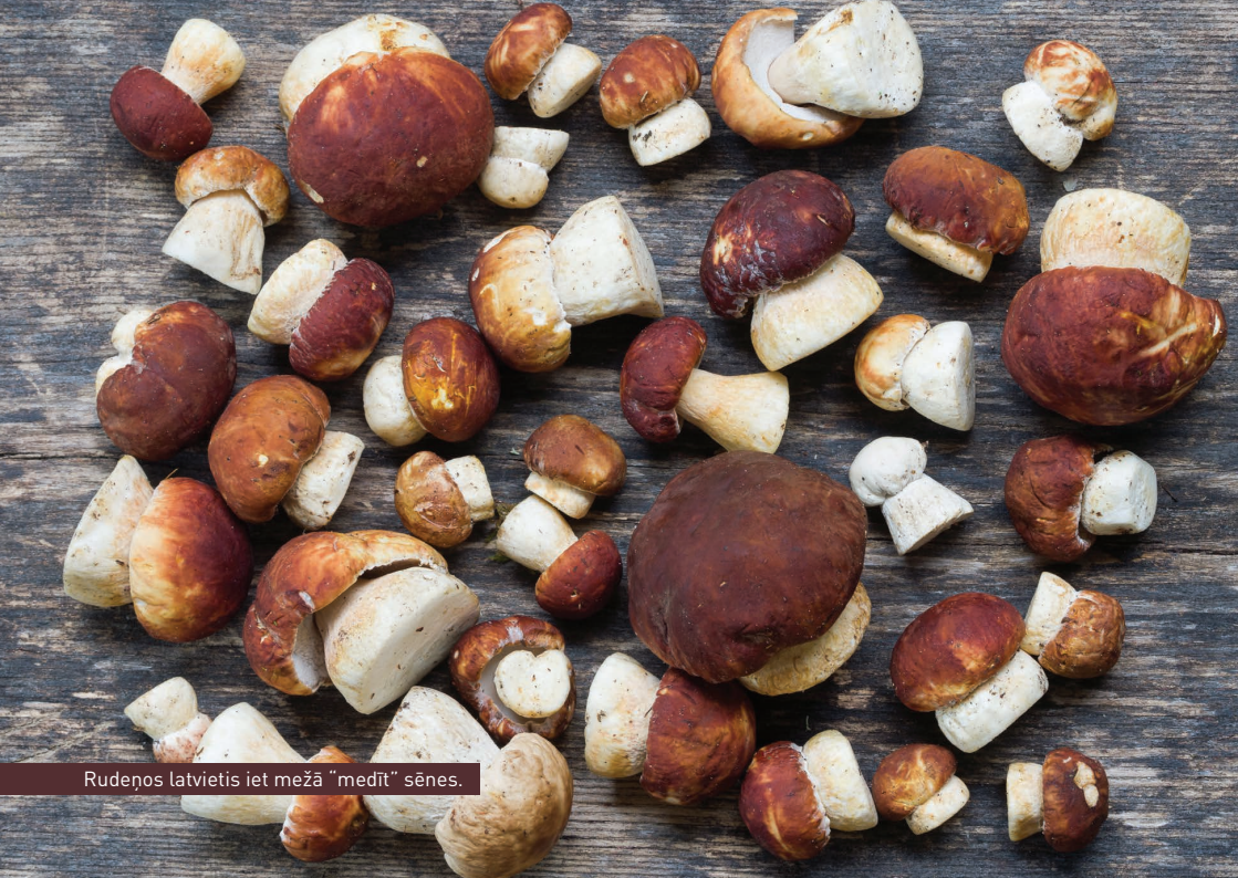
Rūdeņos latvietis iet mežā "medīt" sēnes.