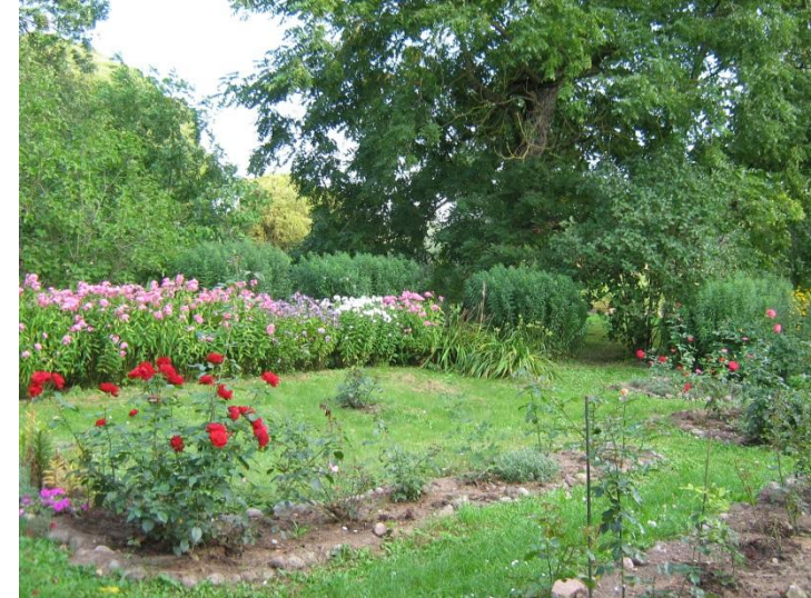
«Billītes»- atjaunots rakstnieces E.Stērstes puķu dārzs un vistērija