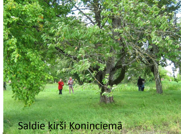
Saldie ķirši Koniņciemā