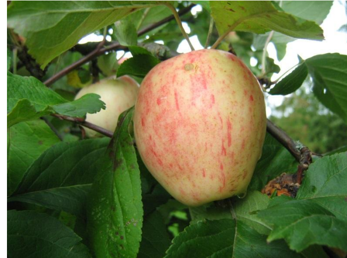
‘Virginy Rose’ Mazmežotnē