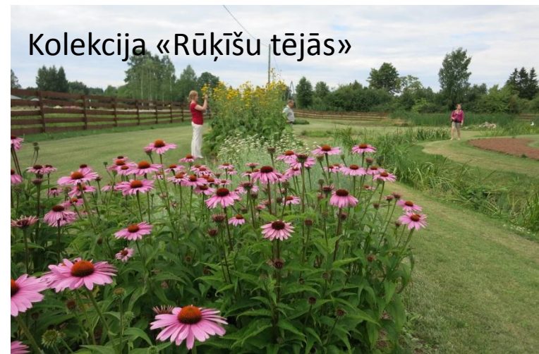
Kolekcija «Rūķīšu tējās»