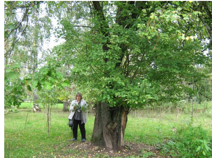
Liela mežābele Arendolē