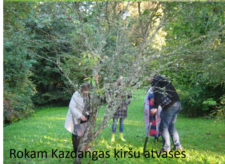
Rokam Kazdangas ķiršu atvases