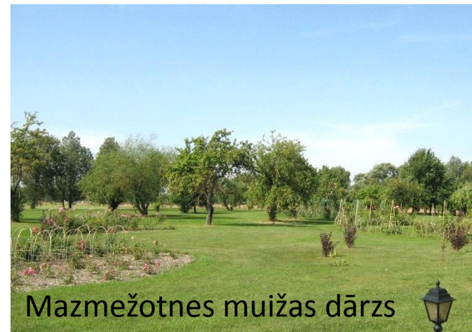
Mazmežotnes muižas dārzs