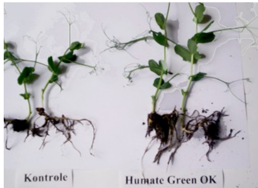
Zirņu sakņu sistēma

Humīnskābju sāļi saista smagos metālus , novēršot to iekļūšanu augos un ūdenskrātuvēs.